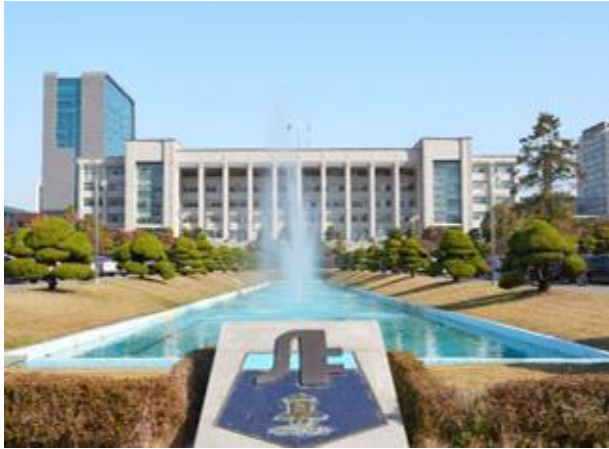
○ The main building of Inha University