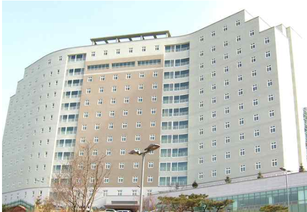
○ Dormitory(2nd Dormitory)