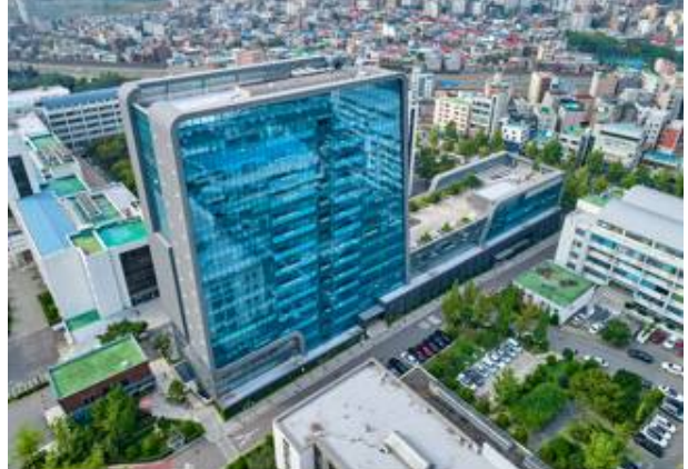
○ 60 th Anniversary Hall