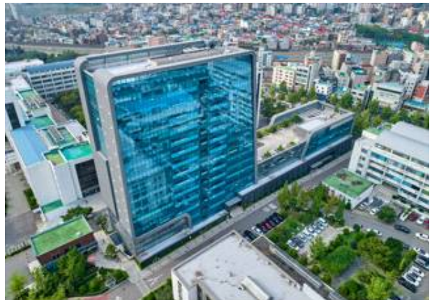
○ 60주년 기념관