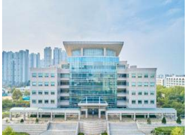
○ Jungseok Memorial Library