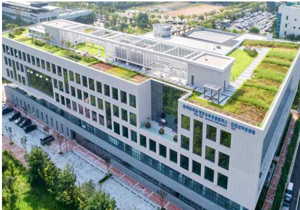
○ Inha-Songdo Aerospace Convergence Campus