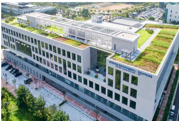
○ 인하대 송도 항공 우주 캠퍼스