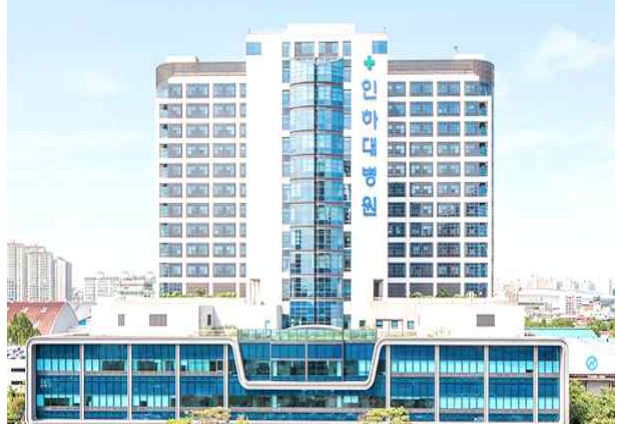
○ Inha University Hospital